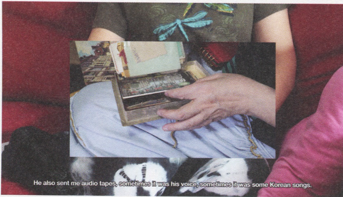
He also sent me audio tapes, sometimes it was his voice, sometimes it was some Korean songs.